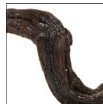
"ONDA" Radice di pino su base in ferro larghezza 52 cm