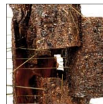
"IL CASTELLO" Cortecia e barre d'ottone su pallet h. 96 cm