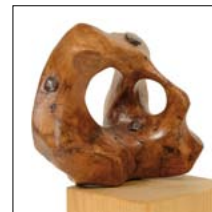
"BUCHI" Radica di bosso su base d'abete, chiodi h. 22 cm