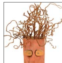
"WHY?" (Self-portrait) Legni vari h. 51 cm