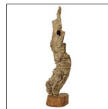
"THE ONE" Ramo di sughero su antico ceppo e ferro h. 135 cm