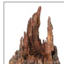
"MORDOR" Termitaio su base in ferro h. 48 cm